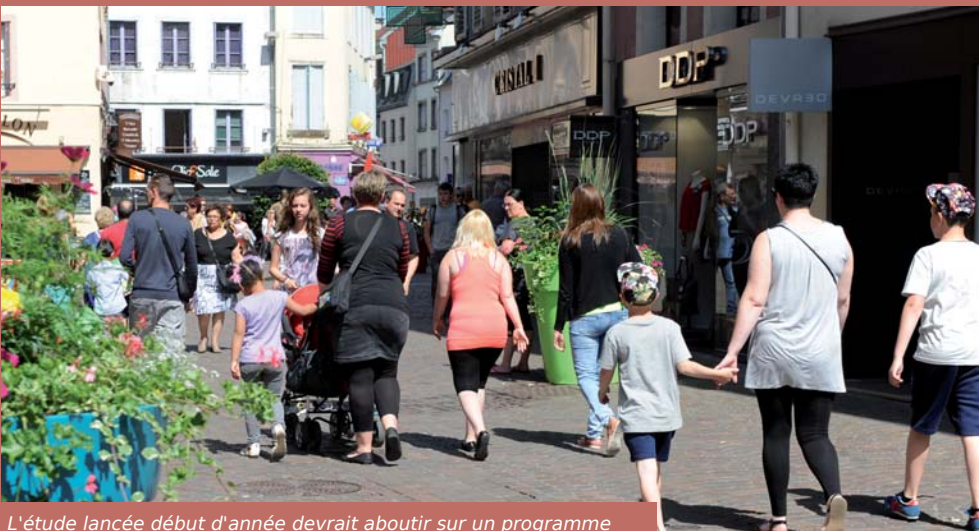
L'étude lancée début d'année devrait aboutir sur un programme d'actions pour la redynamisation du commerce de centre-ville.

Depuis le mois de janvier, à la demande de la Ville, le cabinet Cibles et Stratégies scrute l'appareil commercial montbéliardais, s'enquiert de l'avis des commerçants, des clients, des habitants, pour dégager des pistes de développement et améliorer l'attractivité du centre-ville. Une première étape qui a débouché sur l'organisation d'assises du commerce, le 6 juin dernier en mairie auxquelles ont participé les commerçants et Madame le maire. En parallèle, les services municipaux ont mis en place une cellule de veille chargée de relever les dysfonctionnements techniques, que ce soit en termes de propreté, d'accessibilité ou de cadre de vie. Un ensemble d'actions qui visent à redynamiser le cœur de ville à travers l'offre marchande. L'une des priorités de l'équipe municipale. \ LL