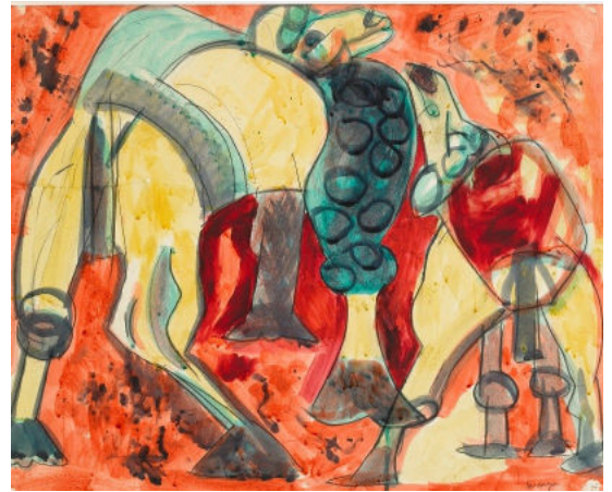
Jean MESSAGIER Le chameau au Jardin des Plantes , vers 1947 Aquarelle sur carton Don de la Société d'émulation de Montbéliard, 2010 Collection musées de Montbéliard © Pierre Guenat Paris, ADAGP, 2021