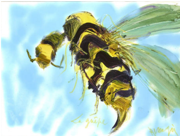
Jean MESSAGIER La guêpe , vers 1973 Bombe aérosol et gouache sur papier Collection particulière

Reportage photographique complet de l'exposition à retrouver sur les pages web des musées