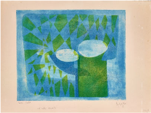
Jean MESSAGIER La vallée enroulée , vers 1949 Aquatinte sur zinc Collection particulière © C.-H. Bernardot Paris, ADAGP, 2021