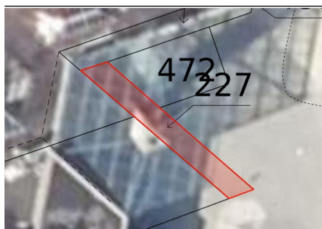
Parcelle BP 227