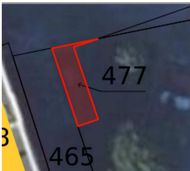
Parcelle BP 477