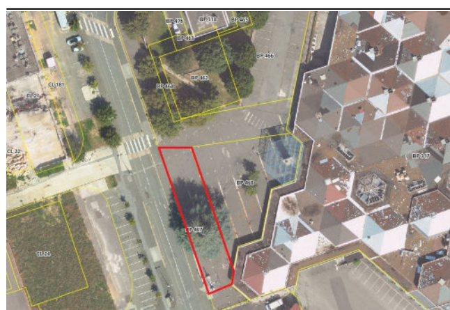
Partie parcelle BP 467